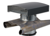
LWF DH 160